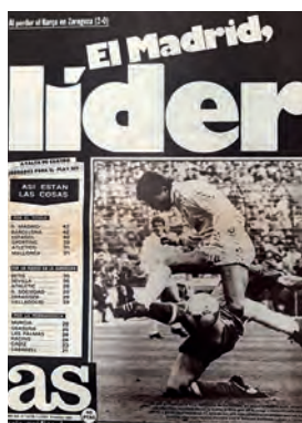
Figura 32. As (Madrid, 9 març 1987)