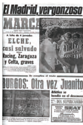
Figura 25. Marca (Madrid, 25 abril 1977) Font: HMV.