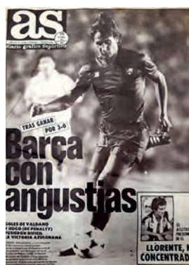
Figura 30. As (Madrid, 1 febrer 1987)

fetes i refranys i fins i tot sobrenoms, expressions masclistes i tòpics locals i regionals.