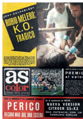
Figura 36. As-Color (Madrid, 21 febrer 1978)