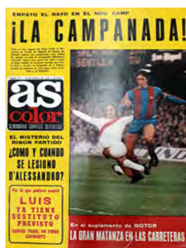
Figura 16. As-Color (Madrid, 10 gener 1978)