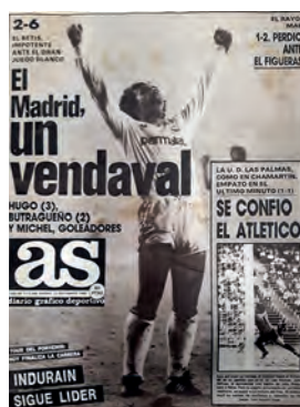
Figura 12. As (Madrid, 22 setembre 1986)