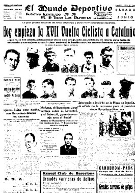
Figura 7. El Mundo Deportivo (Barcelona, 1 juny 1935)

Les fotos predominants són les del futbol (57,1 % d'aparicions), ciclisme (19,6 %) i boxa (8,9 %). As es diferencia de les altres publicacions per la seua extremada cura de la fotografia en portada: fotos grandioses que transmeten acció i moviment propis de l'espectacle esportiu. De fet, el 82,1 % de les fotos retraten emocionants escenes de competicions on els esportistes apareixen com a moderns Aquil·les fent gala de la seua força, habilitat i rapidesa. Només el 17,8 % de les imatges presenten esportistes estàtics. La immensa foto de portada ve explicada no ja amb una escarida frase, com la majoria de periòdics que hem vist, sinó mitjançant un titular