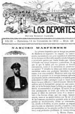
Figura 2. Los Deportes (Barcelona, 14 desembre 1902)