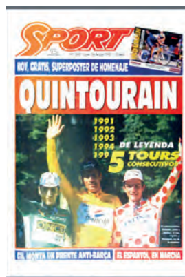
Figura 27. Sport (Barcelona, 24 juliol 1995)