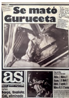
Figura 35. As (Madrid, 26 febrer 1987)