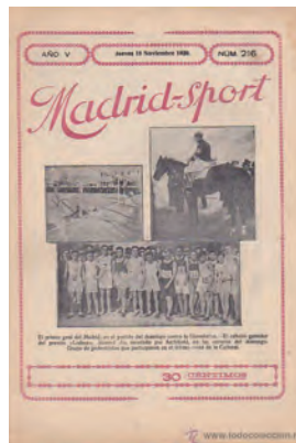
Figura 6. Madrid-Sport (Madrid, 18 novembre 1920)