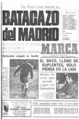
Figura 22. Marca (Madrid, 24 febrer 1977)