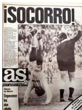
Figura 17. As (Madrid, 29 desembre 1976)