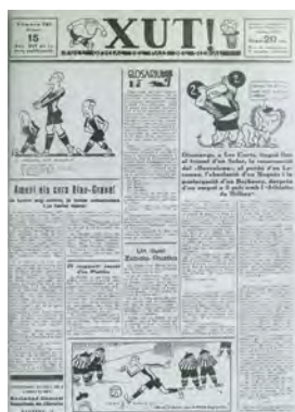
Figura 9. Xut! (Barcelona, 15 gener 1935)