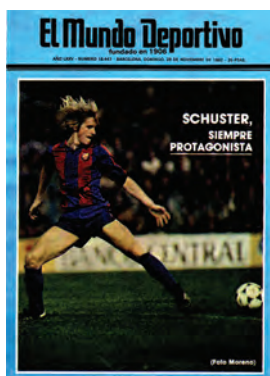
Figura 29. El Mundo Deportivo (Barcelona, 28 novembre 1982)