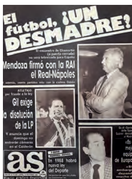
Figura 13. As (Madrid, 10 setembre 1987)