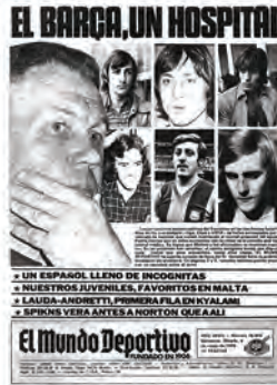
Figura 20. El Mundo Deportivo (Barcelona, 4 març 1978)