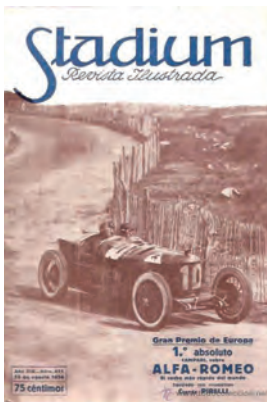
Figura 4. Stadium (Barcelona, 15 agost 1924)