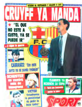
Figura 18. Sport (Barcelona, 6 maig 1988)