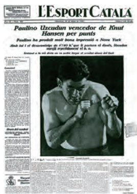
Figura 10. L'Esport Català (Barcelona, 29 setembre 1925)