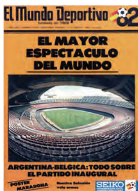
Figura 28. El Mundo Deportivo (Barcelona, 13 juny 1982)