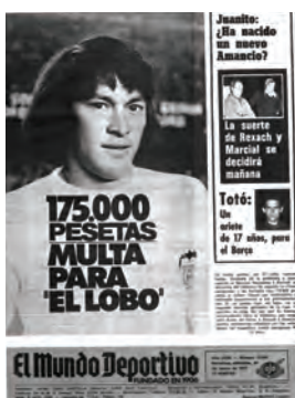
Figura 15. El Mundo Deportivo (Barcelona, 30 març 1977)

De la taula 3 es dedueix que abunden els enquadraments informatius que combinen allò sorprenent i vistós amb una elevada càrrega popular, sensacionalista, apologetica i a vegades populista, sense descuidar les notícies crítiques, morboses, tafaneres i frívoles, i fins i tot algunes amb tocs d'humor. S'observen, a més, quant al missatge, elements informatius que destaquen allò espectacular amb intenció d'exagerar, provocar, acusar, protestar, trivialitzar o simplement fer demagògia sobre accions d'esportistes, equips, entrenadors o directius que segons el criteri