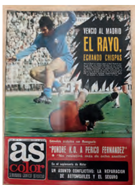
Figura 14. As-Color (Madrid, 1 novembre 1987)