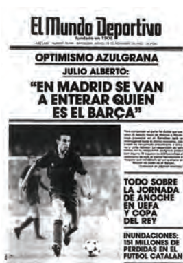
Figura 31. El Mundo Deportivo (Barcelona, 25 novembre 1982)

6. Identificació o identitat territorial. Transmissió d'emocions, de símbols, de tòpics i d'altres identificacions geogràfiques i culturals amb l'objectiu de crear passió,