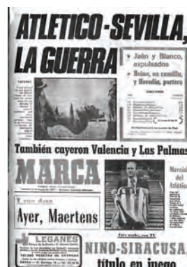
Figura 33. Marca (Madrid, 13 maig 1977)