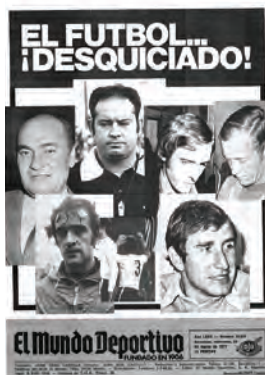
Figura 23. El Mundo Deportivo (Barcelona, 23 març 1977)