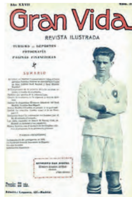
Figura 3. Gran Vida (Madrid, 1 desembre 1929)