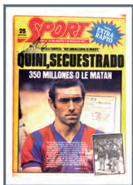
Figura 34. Sport (Barcelona, 3 març 1981)