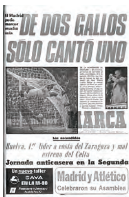
Figura 26. Marca (Madrid, 4 setembre 1978)