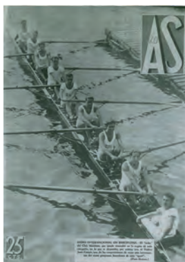
Figura 8. As (Madrid, 18 octubre 1932)