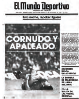
Figura 21. El Mundo Deportivo (Barcelona, 25 setembre 1982)