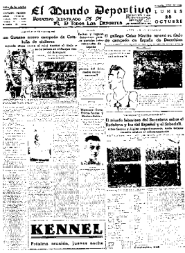
Figura 1. El Mundo Deportivo (Barcelona, 28 octubre 1935)