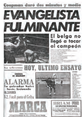
Figura 24. Marca (Madrid, 27 novembre 1977)