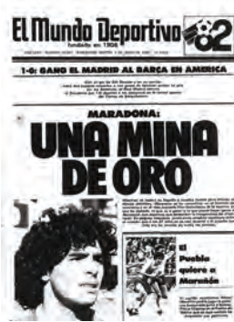
Figura 19. El Mundo Deportivo (Barcelona, 1 juny 1982)